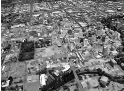
写真3 復興が遅れたクライストチャーチ中心部

またこのほか、復興担当大臣は公示により、2002年地方自治法等に基づく自治体の行政計画等を停止・廃止できる（27条）。この措置に対する損失補償を請求できない（同7条）。