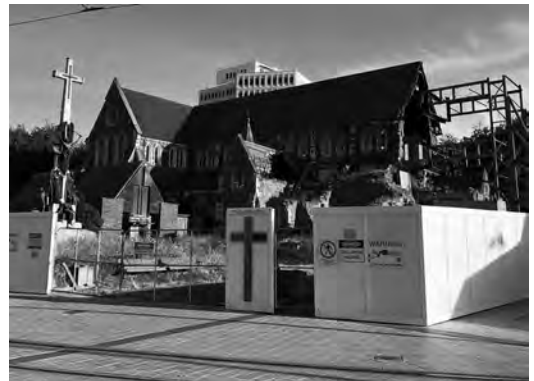
写真5 修復途上のクライストチャーチ大聖堂

値のない草原と化していた（写真4）。CBD再開発に関しては、2012年から用地確保が開始され、約6000戸が立退き、また居住禁止とされたレッドゾーンでは7850戸が立退いたが、これに対して「復興計画」はCBD地区で2万戸の住宅供給をめざすBuild Back Better型の再開発計画を描いている。CBD地区の復興の遅れの背景要因の一つとして、中央集権的な復興計画に対する住民の感情的離反があったのか、検証に値するテーマである。なお、第5節で述べるように、住宅に関する地震保険に比較して、事業用建築物に関する民間保険の加入率は50%程度と低かったことも、CBDの復興の遅れの要因である。われわれが調査した2017年12月時点では、住宅の修理・改築はほぼ終了しているのに対して、商業用ビルはまさに再建ラッシュの最中にあり、教会等の宗教施設の修理が遅れているのが印象に残った。