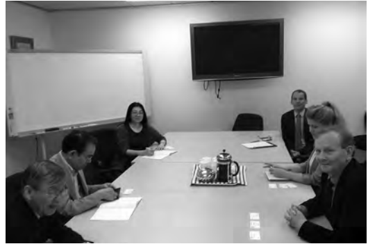
写真2 NZ 保険協会でのヒアリング