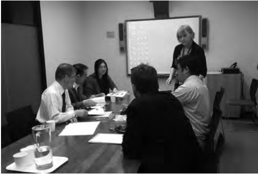
写真1 クライストチャーチ市役所でのヒアリング