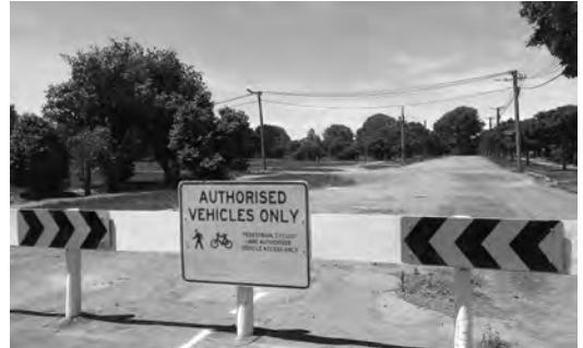
写真4 レッドゾーン

震災7年を経て、中心街区（CBD）の再開発は今なお道半ばの状態にみえ、また国費買上げ対象となった居住禁止区域（レッドゾーン）は利用価